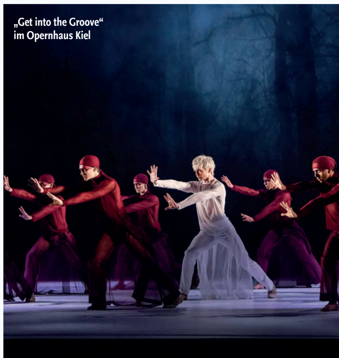
„Get into the Groove“ im Opernhaus Kiel