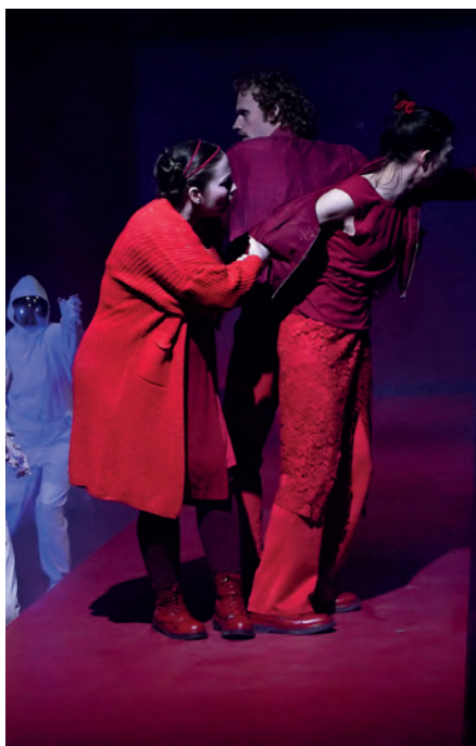
Wiederaufnahme in der Spielzeit 2026/2027: „Antigone“ im Jungen Theater im Werftpark