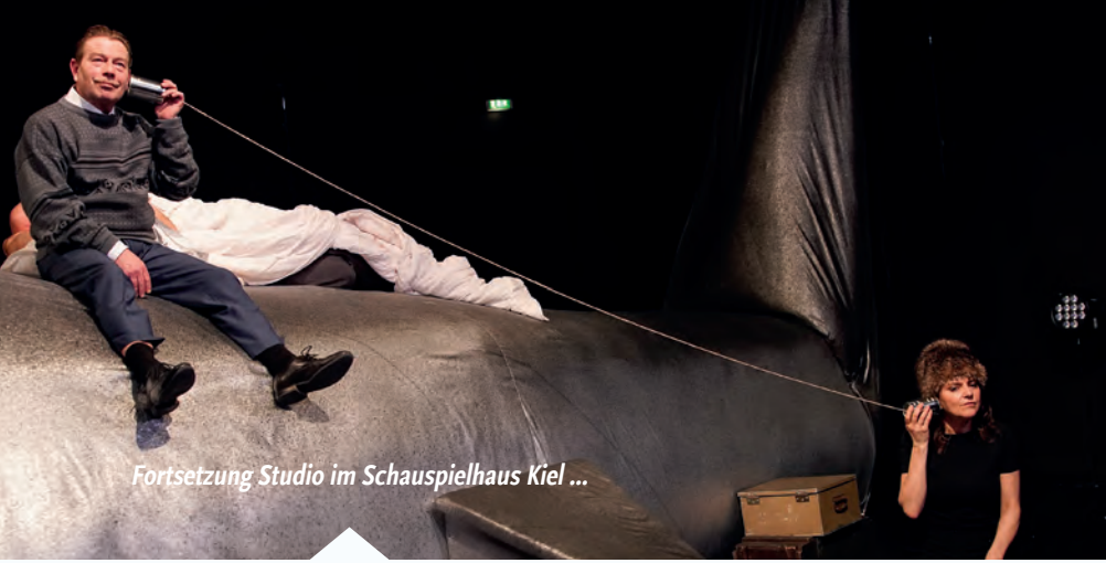
Fortsetzung Studio im Schauspielhaus Kiel ...