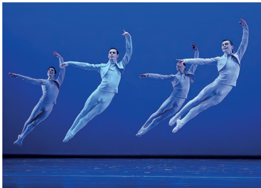
Wiederaufnahme in der Spielzeit 2025/2026: „Balanchine – Lee – Ivanenko“ im Opernhaus Kiel