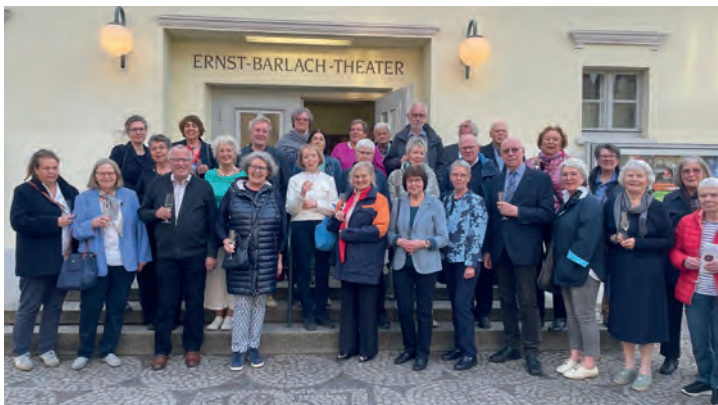
Teilnehmer der Güstrow-Reise im April 2025