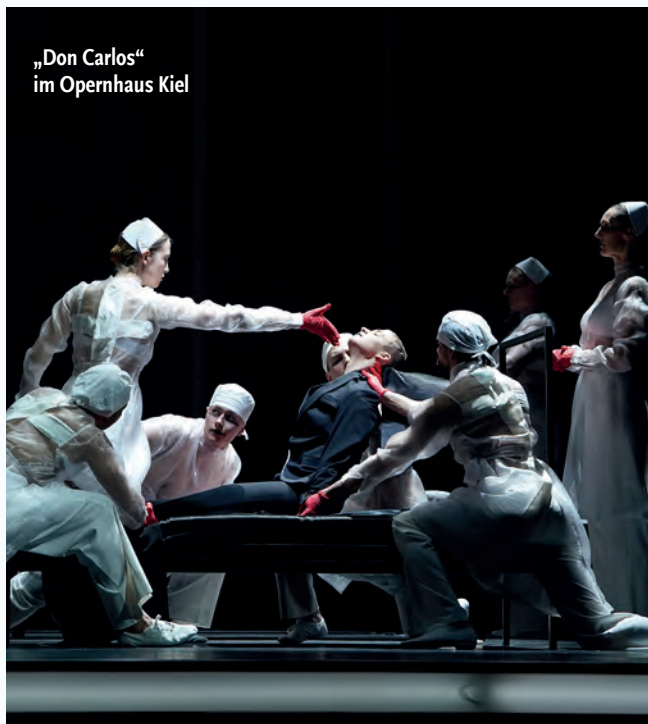
„Don Carlos“ im Opernhaus Kiel