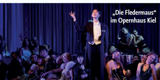
„Die Fledermaus“ im Opernhaus Kiel